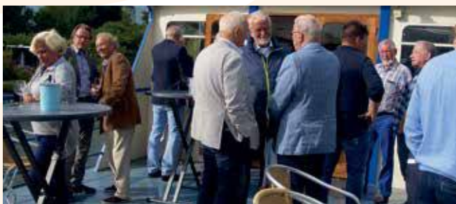
Het Maritiem Evenement van 2019 vond op de Loosdrechtse Plassen plaats en werd zeer druk bezocht.

De werkgroep organiseert periodiek verschillende activiteiten gericht op het post-actieve en veteranen ledenbestand van de KVMO. Deze evenementen zijn nu: de jaarlijkse 64-jarigendag, het jaarlijkse Maritiem Evenement en de tweejaarlijkse KVMO-Veteranendag.